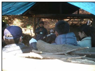
2011年02月13日 炭焼き窯の前で代表の説明 を聞く来場者の皆さん。初 めて見る炭焼き窯に興味津 津の様子。