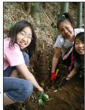
2011年03月06日 竹林整備 写真では傾斜がわかりませんが、急斜面ばかりで緩斜面はありません。