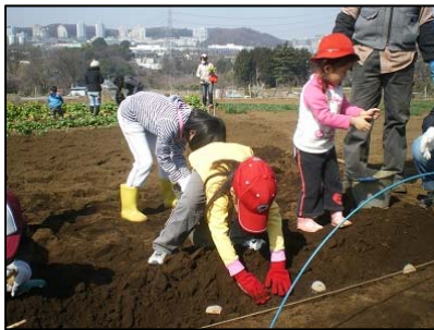
2011年02月27日 ジャガイモの植付け体験