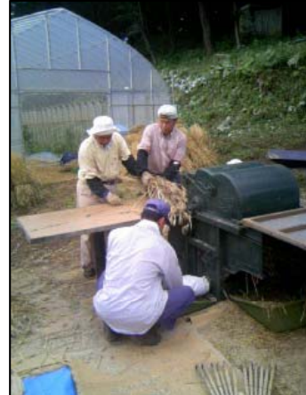
2011年06月19日 脱穀 大麦、小麦の脱穀です。特に チームワークが必要な作業で す。