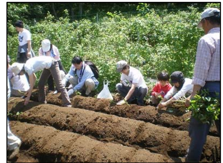
2011年05月15日 サツマイモの植え付け