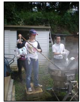
昨年の麦茶焙煎風景 1回の焙煎は、5、6 人で交代で約50分 ぐらい掛かり、終わ るころには汗だくだ す、