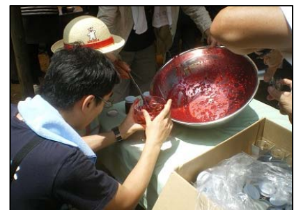
2011年07月02日 稲城市民限定ラズベリージャム 作り体験教室