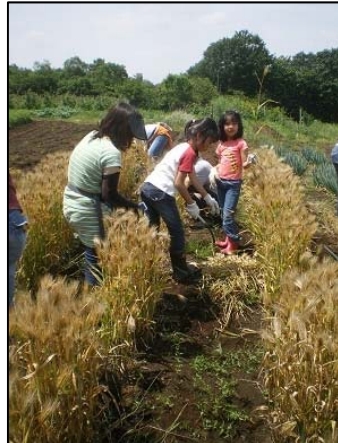
2011年06月04日大麦刈り 2011年06月05日小麦刈り