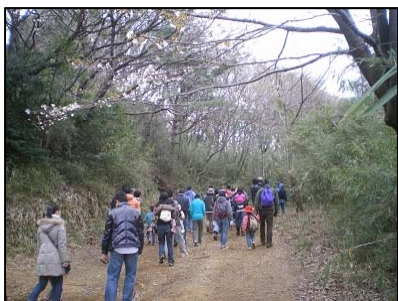
2011年04月03日 里山の早春散策 道幅が広くなったところに出ま した。見上げるとこの山で一番 先に咲くヤマザクラの花が。