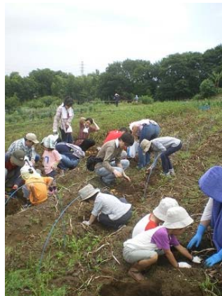
2011年06月25日 ジャガイモ掘り